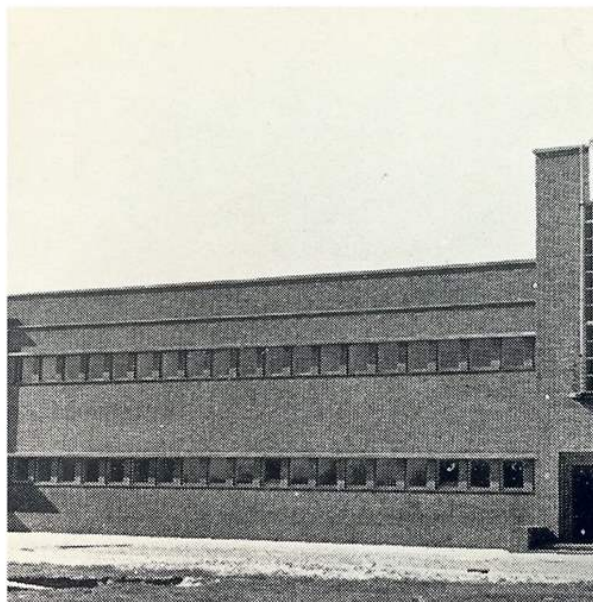
De Wilgenhoek vlak na de oplevering van het gebouw.