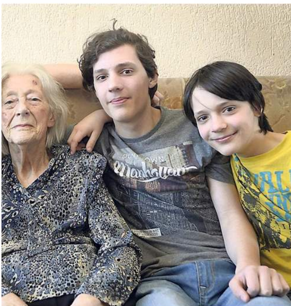
de kinderen van nu."